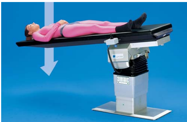
OP-Tischplatte Carbon X-tra – Eine Ergänzung zum Wechsellattensystem JUPITER

Intraoperative Diagnostik ist ein Schlüssel für erfolgreiches und wirtschaftliches Operieren. Die modularen TRUMPF Carbon OP-Tische und Elemente wurden für alle Eingriffe entwickelt und erlauben störungsfreie Bildgebung genau dort, wo der Operateur sie benötigt.