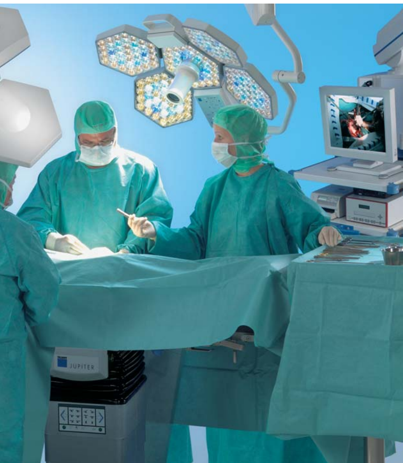
JUPITER – Das Wechseltischsystem

Flexible und zeitsparende Ablauforganisation im OP