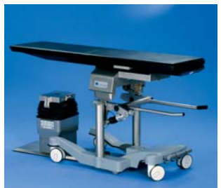
Shuttle beidseitig andockbar

Das modulare JUPITER Wechselplattensystem deckt alle Einsatzgebiete der modernen diagnostischen und operativen Medizin ab. Ausstattung, Funktionalität und Erweiterungsfähigkeit machen den JUPITER zum OP-Tisch der Spitzenklasse.