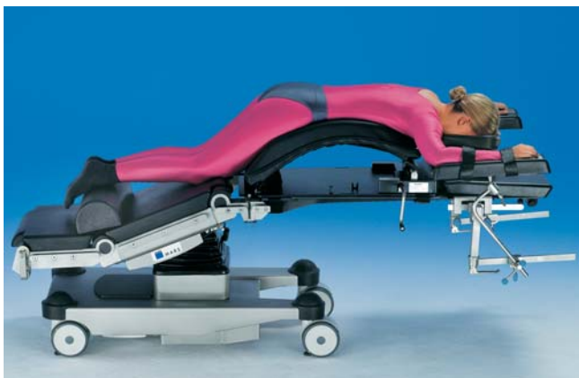
MARS Niedrigversion, z. B. für Wirbelsäulenchirurgie