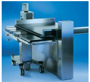
ORBITER – Problemlose und kraftsparende Umbettung von Patienten