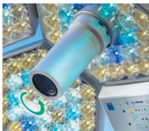
Integrierte Videokamera mit motorischer Bildaufrichtung