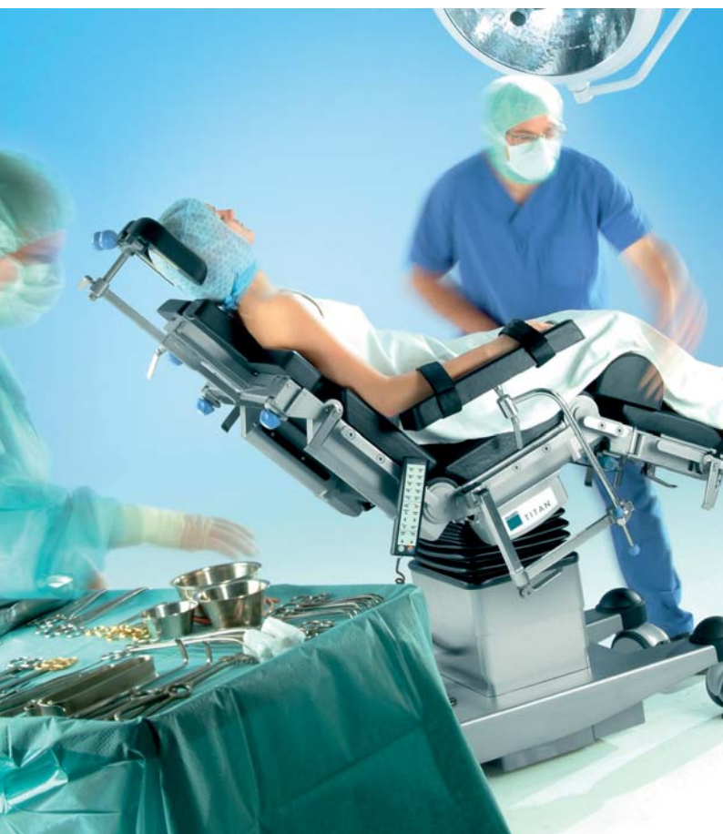
TITAN – Der Schwerlasttisch mit Fahrtrieb

Schnelle und präzise Lagerung vor und im Operationssaal