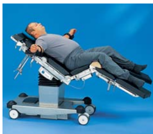
TITAN – Bis 450 kg Patientengewicht

Flexibel, mobil und stark bei moderaten Kosten. Leicht beweglich dank motorischer Fahr- und Bremsunterstützung. Extrem niedrige Spezialversion für Operationen im Sitzen.