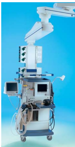
Motorische Höhenverstellung bei 180 kg Tragkraft

Die Deckenstative von TRUMPF in drei Gewichtsklassen erlauben maßgeschneiderte Systemlösungen in Anästhesie, Minimalinvasiver Chirurgie, Endoskopie, Intensivpflege, Neonatologie und Notfallmedizin.