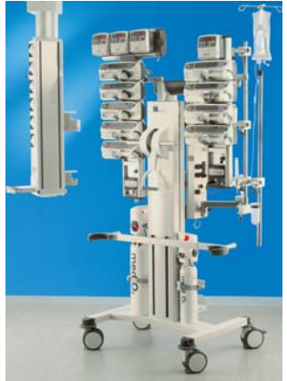
IMEC – Sicherer und effizienter Transport für Patient und Personal

Potenziale für Einsparungen im Krankenhaus stecken vielfach in der Optimierung von Abläufen. TRUMPF Patiententransportsysteme bilden eine Produktfamilie für den innerklinischen Patiententransfer und erlauben intraoperative Diagnostik. Sie optimieren die Behandlungsabläufe, erleichtern die Arbeit und erhöhen die Sicherheit der Patienten.