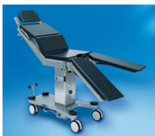
MERKUR – Leichtes Handling

Elektromotorische Säulen- und gasfederunterstützte Plattenfunktion ermöglichen einfaches Handling. Mechanische Längsverschiebung und optionale Sitzplattenverlängerung sichern eine ausgezeichnete Röntgenfreiheit.