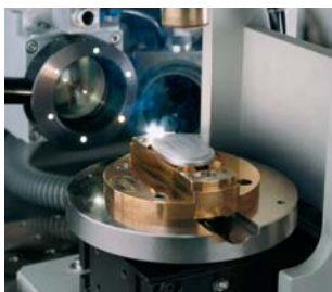
Beschriftung von Herzschrittmachern