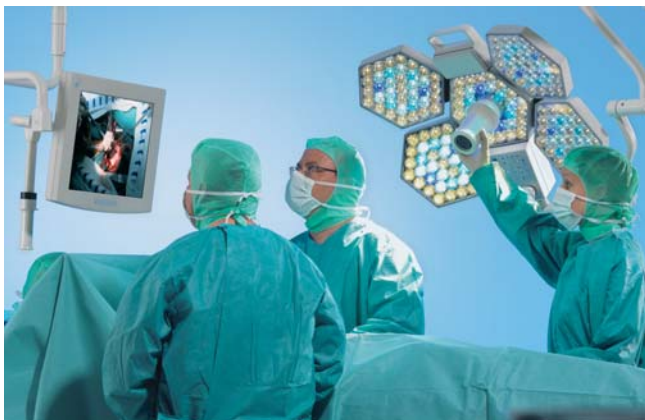
Digitale Bildübertragung und Archivierung während der OP

Die erste steril bedienbare OP-Leuchten-Kamera mit SDI-Ausgang und Standbildspeicherfunktion ermöglicht Live-Übertragungen aus dem OP in digitaler Videoqualität ebenso wie die schnelle, direkte Archivierung von Standbildern.