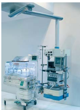
uniPORT in der Neonatologie

Ergonomisch und zukunfts- sicher für den harten Einsatz in Klinik und Praxis.