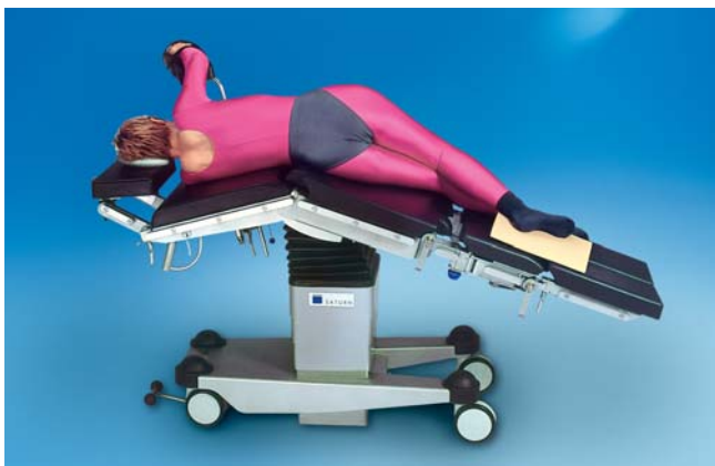
SATURN Select, Nierenlagerung