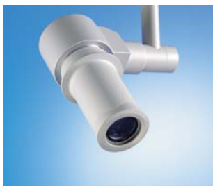
Kamera am separaten Tragarm

Die erste steril bedienbare OP-Leuchten-Kamera mit SDI-Ausgang und Standbildspeicherfunktion ermöglicht Live-Übertragungen aus dem OP in digitaler Videoqualität ebenso wie die schnelle, direkte Archivierung von Standbildern.